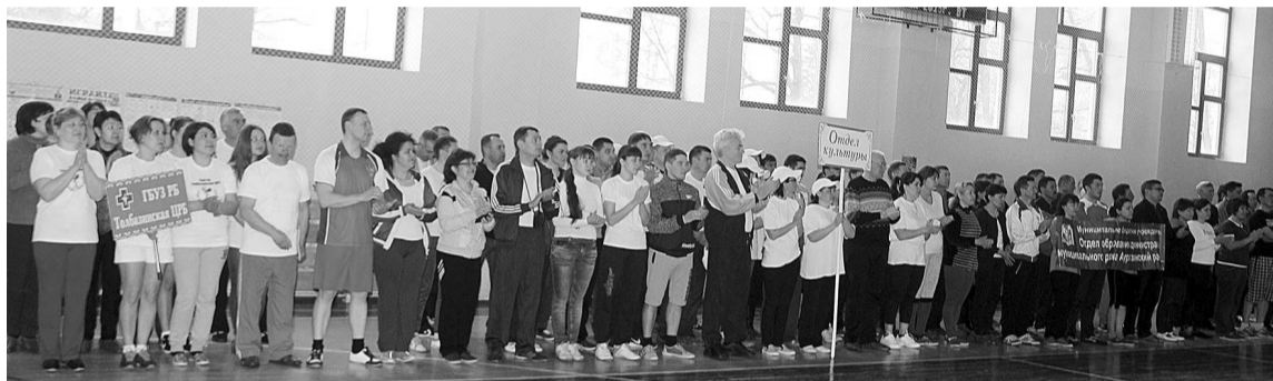
Члены профсоюза принимают активное участие в Спартакиаде среди трудовых коллективов района

Я хотел бы обратить внимание социальных партнёров – руководителей предприятий и организаций района, на то, что нужно, чтобы социальное партнёрство, взаимодействие с профсоюзами было налажено не только на словах, но и на деле: только так можно добиться социального благополучия работников, создать положительный климат в коллективах и поддерживать стабильность в обществе.