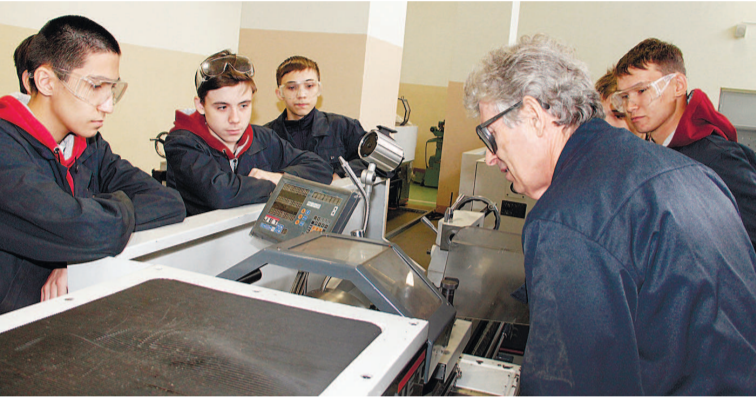
Новобранцам УМК и УАТ предстоит большую часть учебы проводить на производстве

Новобранцам УМК и УАТ предстоит большую часть учебы проводить на производстве. Практика займет 70% их времени, а теория – всего 30%. Учиться студенты будут по направлениям «Обработка металлов резанием» и «Мехатроника».