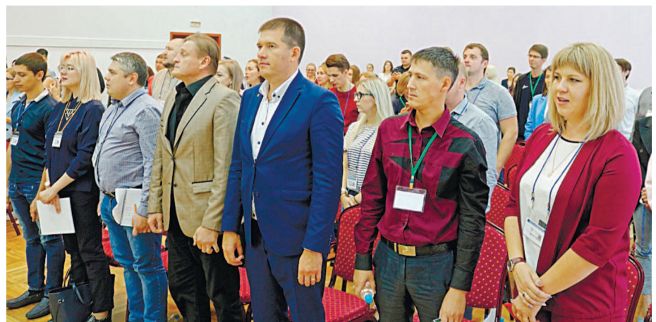
В рамках форума в Светлогорске прошёл XII Всероссийский семинар-совещание по вопросам молодёжной политики ФНПР