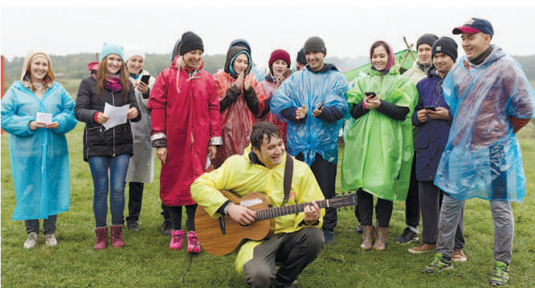
Конкурс «профсоюзно-туристической» песни