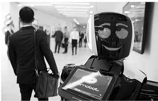
«Введите на меня налог!»