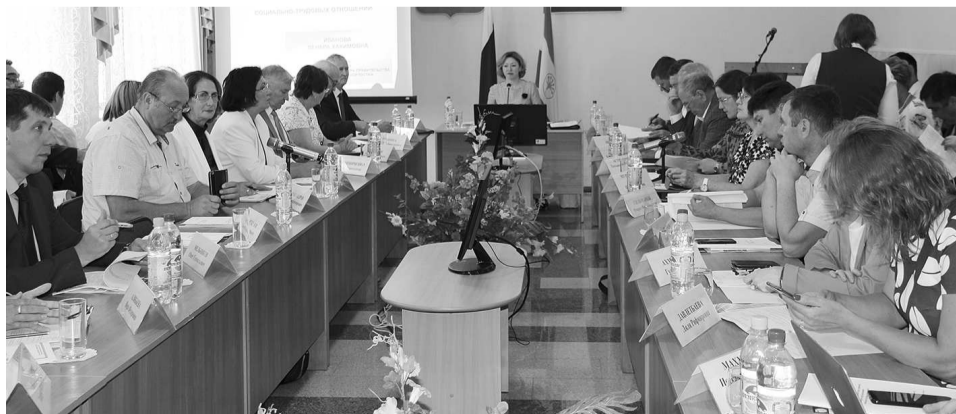
Толчок развитию социального партнёрства придало и прошедшее минувшим летом на территории Толбазов выездное заседание РТК