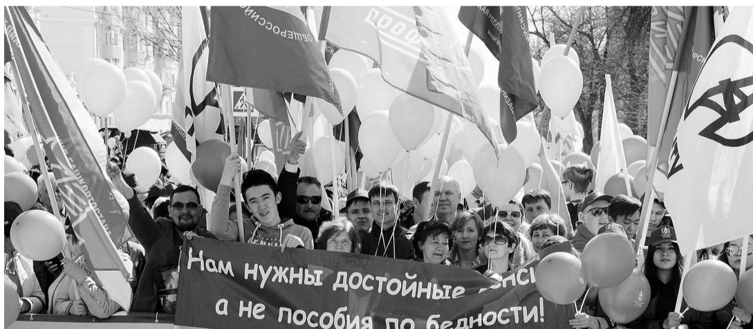
Человеку труда есть о чём сказать 1 Мая

В преддверии Первомай мы провели традиционный опрос среди жителей Уфы.