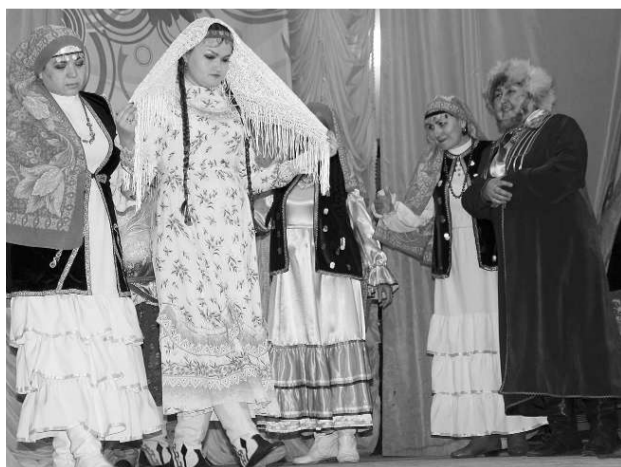
1 место взял коллектив из Детско-юношеского центра «Юность» с башкирской легендой об одной из шиханских гор

Всего в фестивале приняли участие 23 педагогических коллектива. В основном это были учреждения дошкольного и допол-