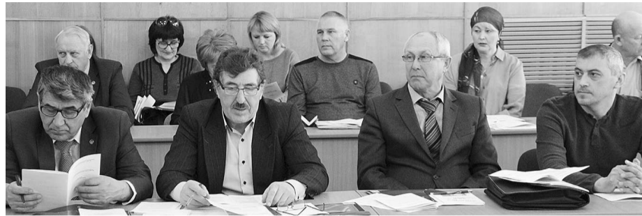
Ряд проблем в деятельности профсоюза отрасли требует безотлагательного решения

Вопрос о развитии социального партнёрства в сфере агропромышленного комплекса РБ и организационном укреплении стал основным на IX Пленуме рескома профсоюза работников АПК РБ.