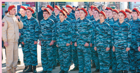
Ребята получили знаки отличия

450 юных туймазинцев пополнили ряды «Юнармии»