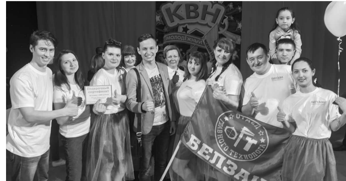
1 место заняла команда «Лидер»

Под таким известным с некоторым пор на всю Россию девизом прошёл на днях в Белебее молодёжный КВН, организованный профсоюзом.