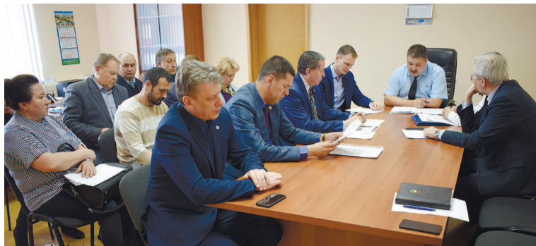
Причины несчастных случаев из года в год одни и те же

Один из смертельных ЧП произошёл на ПАО «Нефтекамский автозавод», где 7 февраля электрогазосварщик при демонтаже оконных рам в результате опрокидывания технологической площадки упал с высоты. Как выяснилось в ходе расследования, причиной тому послужило несо-