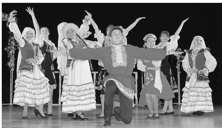
На конкурс поступило более 60 заявок на участие в 10 номинациях

В общей сложности на конкурс поступило более 60 заявок на участие в 10 номинациях. Из-за такого большого числа желающих блеснуть своим талантом организаторам пришлось пересмотреть программу проведения конкурса и