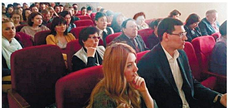
Одним из основных вопросов стало проведение СОУТ в организациях

В преддверии Всемирного Дня охраны труда в администрации Кировского района г. Уфы состоялось расширенное заседание районного Координационного совета по вопросам охраны труда, на котором присутствовали руководители и специалисты по охране труда из 58 предприятий и организаций района.