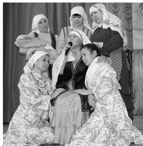
Гран-при у детсада № 49

из детского сада № 46 по стихотворению Самуила Маршака «Как мужик корову продавал».